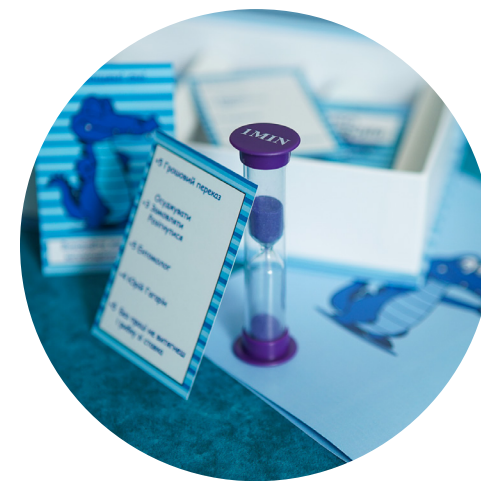
Страховая компания ВУСО